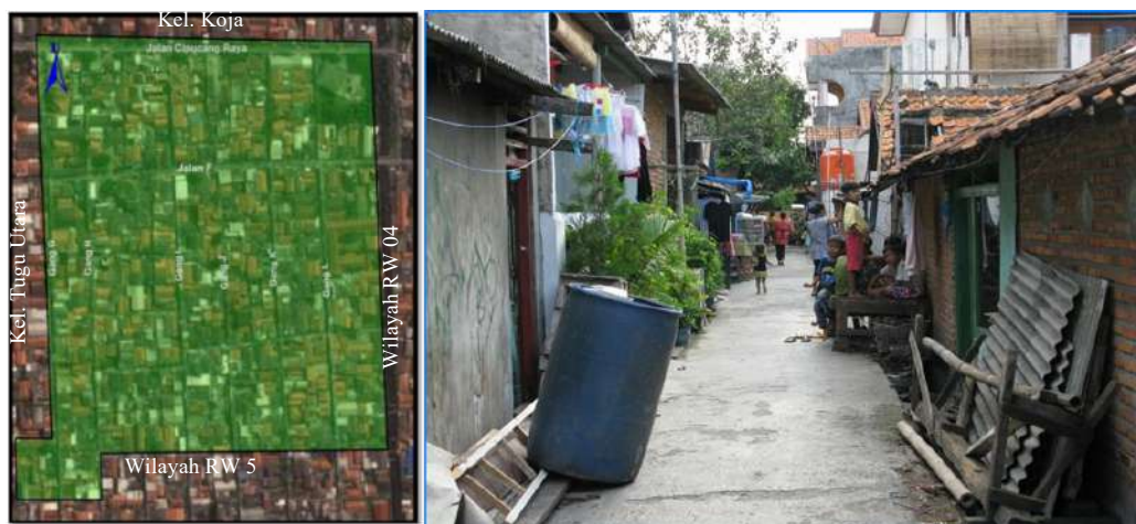
Gambar 2. Lokasi Kajian Wilayah RW 02 Kelurahan Rawa Badak Utara (Foto Gang H2 RT 05)

Lingkungan kumuh yang merupakan konsekuensi dari perkembangan kota yang perencanaannya belum tertata dengan baik, sehingga keberadaannya justru menjadi permasalahan yang pada akhirnya akan menurunkan kualitas lingkungan kota adalah salah satu akibat dari semakin tumbuh dan berkembangnya kawasan kumuh. Kekumuhan ini bervariasi dari tingkat kumuh ringan (kuring) sampai sangat kumuh/ kumuh padat (kupas), sebagaimana uraian mengenai masing-masing wilayah RW dijelaskan pada uraian berikut ini: