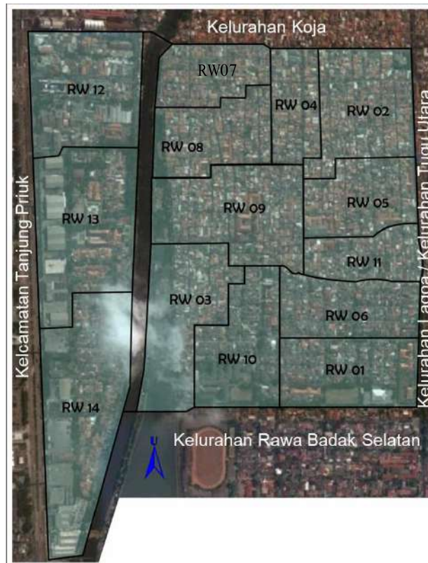
Gambar 1. Lokasi Kajian Kelurahan Rawa Badak Utara