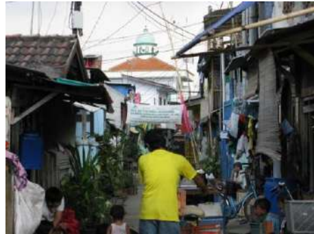
Gambar 7. Lokasi Kajian Wilayah RW 08 Kelurahan Rawa Badak Utara (Foto RT 10)