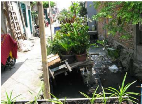
Gambar 8. Lokasi Kajian Wilayah RW 09 Kelurahan Rawa Badak Utara (Foto RT 09)