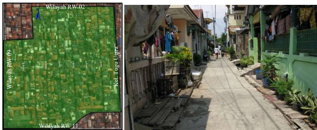
Gambar 5. Lokasi Kajian Wilayah RW 05 Kelurahan Rawa Badak Utara (Foto RT 02 dan RT 03)