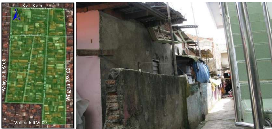
Gambar 4. Lokasi Kajian Wilayah RW 04 Kelurahan Rawa Badak Utara (Foto RT 01) Sumber: Dokumentasi pribadi, (2010)