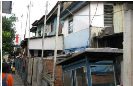
Gambar 9. Lokasi Kajian Wilayah RW 011 Kelurahan Rawa Badak Utara (Foto Jalan AA RT 01)