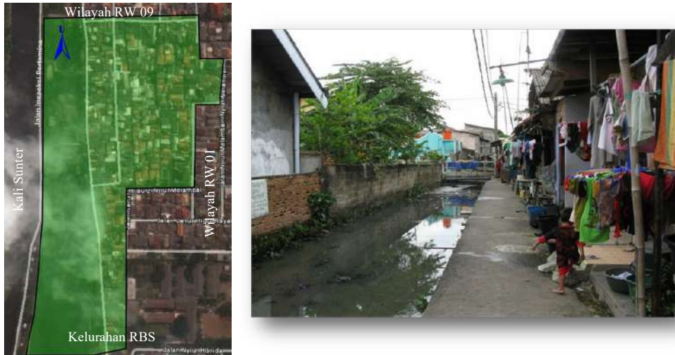
Gambar 3. Lokasi Kajian Wilayah RW 03 Kelurahan Rawa Badak Utara (Foto RT 04)