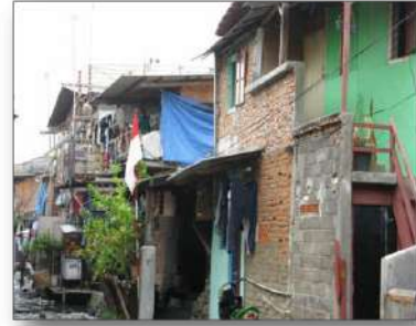
Gambar 6. Lokasi Kajian Wilayah RW 07 Kelurahan Rawa Badak Utara (Foto RT 10 dan RT 11)