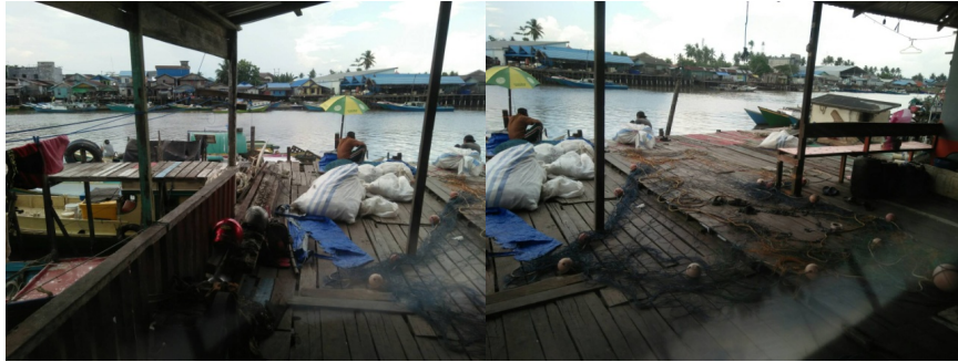
Gambar 4. Perahu sebagai alat dan media para nelayan dalam aktivitas melaut (gambar kiri); aktivitas pengolahan ikan masyarakat kampung Manggar (gambar kanan) (Sumber: Penulis, 2019).

Berdasarkan tiga ruang terbuka yang diamati, aktivitas yang dilakukan masyarakat dalam ruang-ruang terbuka kampung Manggar didominasi oleh necessary activities untuk memenuhi kebutuhan pekerjaan. Selain itu, secara umum social activity muncul sebagai aktivitas resultan dari aktivitas yang lainnya. Keterlibatan pengguna yang tinggal dalam area yang sama dan melakukan aktivitas rutin sehari-hari menghasilkan interaksi dan komunikasi yang secara alami terjadi. Interaksi sosial tidak muncul karena paksaan untuk berbincang, dan juga tidak mensyaratkan kepentingan tertentu dari pengguna tertentu pula. Tingkat kemunculan aktivitas di ruang terbuka A, B, dan C digambarkan perbandingan frekuensi aktivitas (gambar 5).