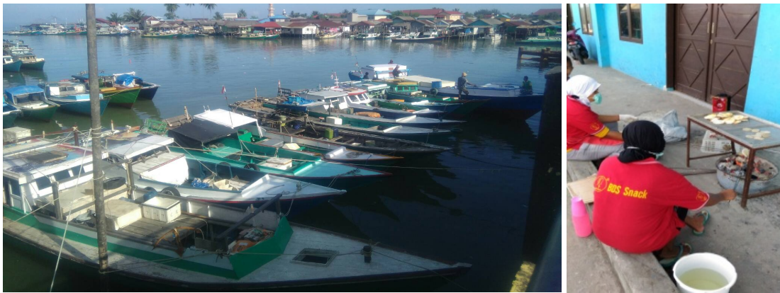
Gambar 2. Perahu sebagai alat dan media para nelayan dalam aktivitas melaut (gambar kiri); aktivitas pengolahan ikan masyarakat kampung Manggar (gambar kanan).

Selain aktivitas rutin, pada ruang terbuka B ditemukan aktivitas yang tergolong pada optional activities . Hal tersebut dilihat dari kepentingan pengguna sebagai pendatang dengan tujuan relaksasi dan tidak terpaku pada kebutuhan pekerjaan. Mekanisme yang dilakukan adalah duduk, menunggu dan memancing (gambar 4). Tidak terdapat pertimbangan khusus atas pemilihan ruang untuk aktivitas tersebut dan tidak terdapat kaitan antara aktivitas dengan kelompok tertentu. Kondisi tersebut membuat ruang terbuka B tidak hanya memiliki peran sebagai everyday place , tetapi juga place of retreat bagi sebagian orang, dengan aktivitas tertentu.