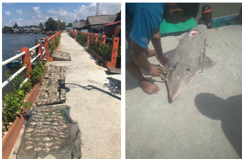
Gambar 3. Pemanfaatan jalur pejalan kaki sebagai area penjemuran ikan (gambar kiri); aktivitas pemindahan dan pemilihan ikan hasil tangkapan (gambar kanan).